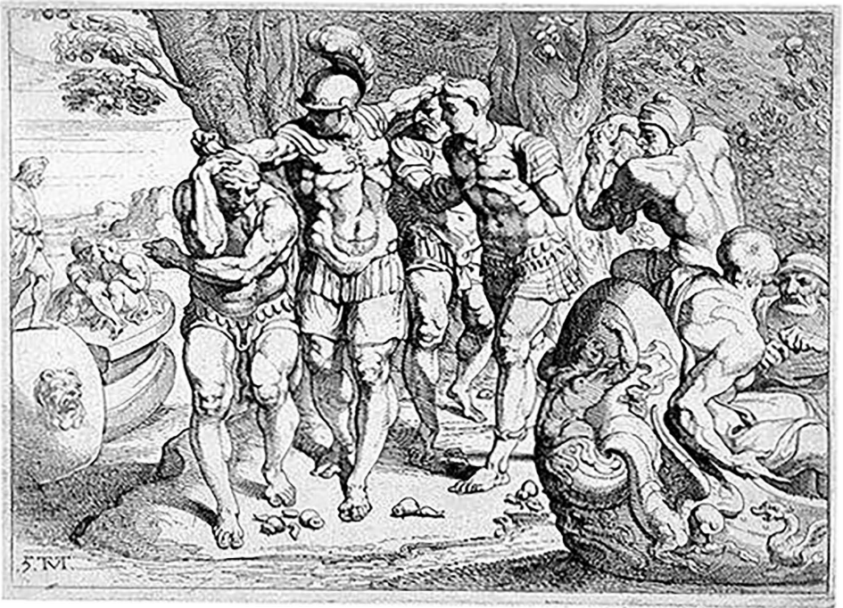
Ulysse chez les Lotophages, gravure française du XVIIIe siècle