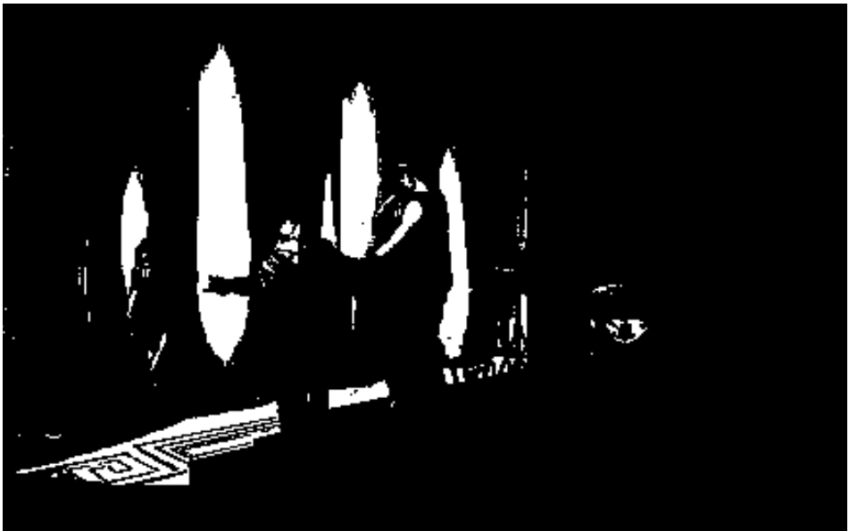
Euryclée conduit Pénélope auprès d'Ulysse