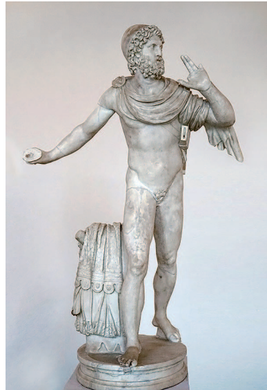
« Ulysse, roi d'Ithaque », statue romaine, 138-192 ap. J.-C. Musée archéologique, Venise