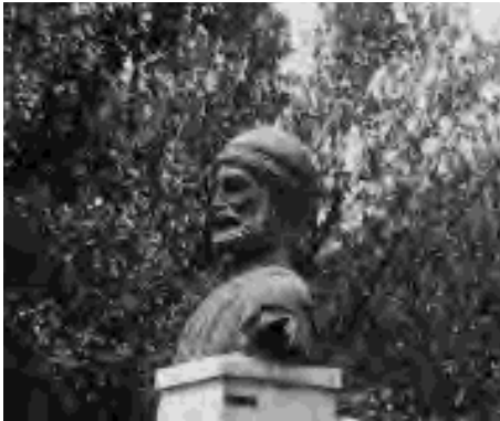
▲ Statue d'Ulysse à Stavros (Ithaque)

Dans le passage de la page 128 de « Léiôdès » à « prétendants », on relèvera les formes pour les analyser. On ajoutera pour l'imparfait la valeur itérative (répétition ou habitude) de « s'asseyait » et de « s'indignait ».