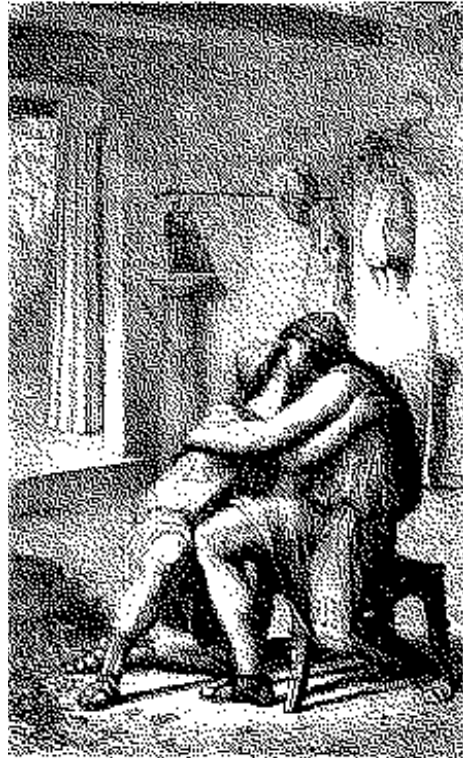
▲ Reconnaissance d'Ulysse et de Télémaque

Ulysse doit soit se cacher (le Cyclope, brouillard magique chez les Phéaciens), soit clamer son nom. Parvenu en Ithaque, c'est sous l'apparence d'un vieillard misérable qu'il se présente. Si l'un est faible, laid, humble, l'autre est fort, beau et roi. La reconnaissance en sera d'autant plus éclatante.