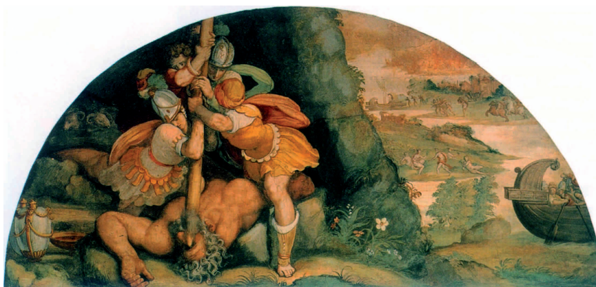
Alessandro Allori, « L'Aveuglement de Polyphème », fresque, 1580, palais Salviati, Florence