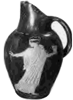
Attique, ► v e siècle av. J.-C. Circé se sauve, poursuivie par Ulysse

répondra qu'il ne reste qu'un bateau à Ulysse. Le processus d'esseulement du héros, qui perd ses compagnons les uns après les autres, continue inexorablement comme l'a annoncé Zeus (« Seul sur un radeau », p. 16). Le récit d'Ulysse répond par anaphore à la question que se posait le lecteur : pourquoi est-il seul chez Calypso ?