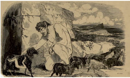
Ulysse s'échappe de la grotte de Polyphème, gravure du XIXe siècle

tissant sa toile. Cette qualité permet à Ulysse d'échapper aux périls qu'il affronte. Pris au piège par le Cyclope dans sa grotte, il réfléchit et invente un stratagème (« Je restai à me demander comment je pourrais me venger », p. 49). Le piège est construit : tailler le pieu, enivrer Polyphème, prétendre s'appeler Personne, crever l'œil, fuir sous les moutons.